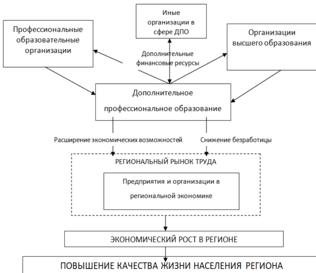
Рис. 1. Влияние развития дополнительного профессионального образования на региональную экономику и повышение качества жизни населения